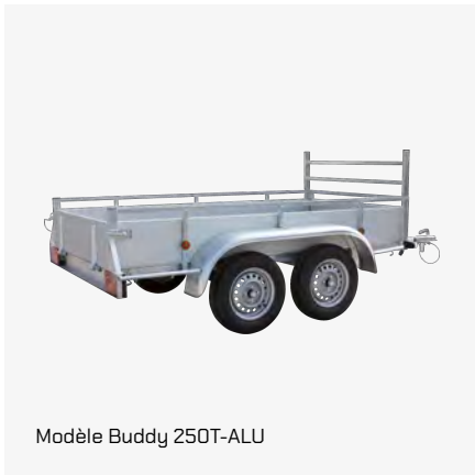
Modèle Buddy 250T-ALU