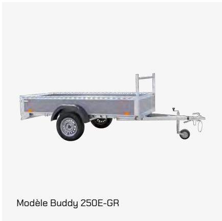
Modèle Buddy 250E-GR