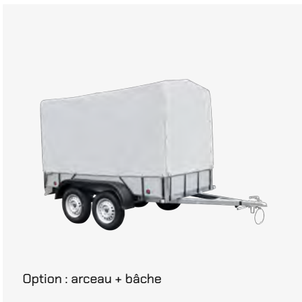
Option : arceau + bâche