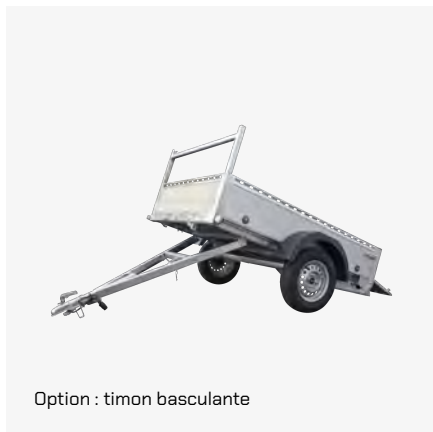
Option : timon basculante