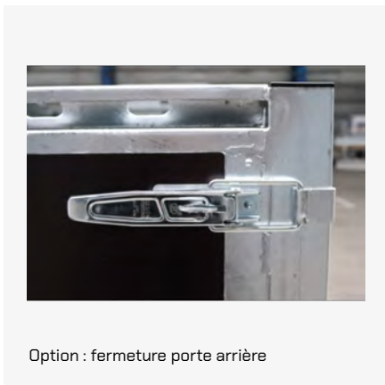
Option : fermeture porte arrière