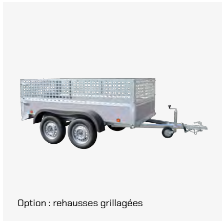
Option : rehausses grillagées