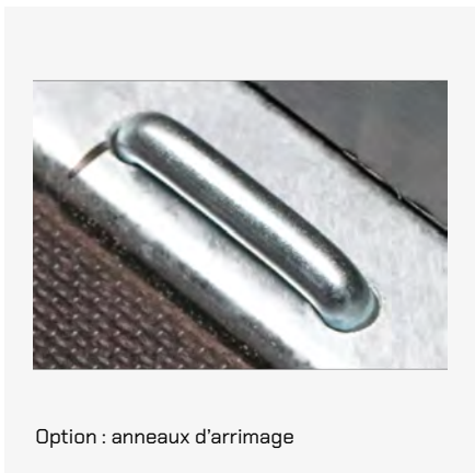
Option : anneaux d'arrimage