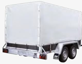
Option : bâche haute