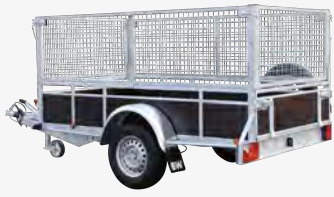
Option : rehausses grillagées