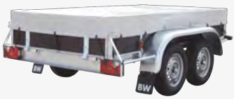
Option : bâche plate